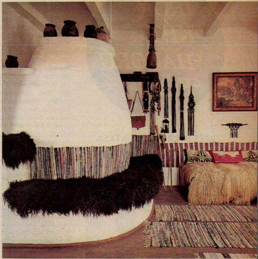
Egy minden ízében régi lakószoba Nagyivánban