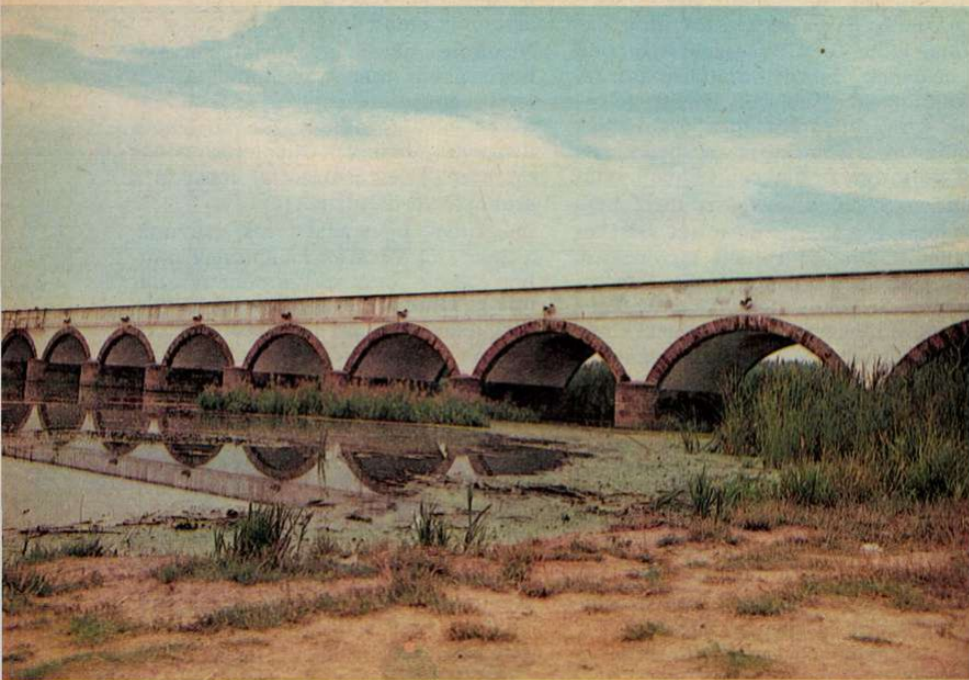
Még süt a nap, de a kilenclyukú hid felett felhő sötétedik...