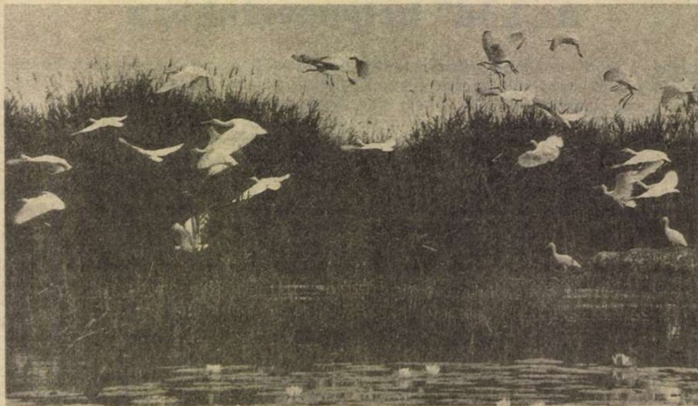
A kanalas gémelek röpte

északon újabban sokkal fokozottabban védik. S milyen állatok tartoznak a különösen védettek közé a mocsárvilágban? A vidra és a teknős mindenképpen. S milyen furcsaságok esnek az állatok cirkulációjában? Hébe-hóba lehet itt látni sakkalt és nyestkutyát, de került már jávorszarvas is, holott ezeknek az oktanoknak nincs erre semmi keresnivalójuk. Meglátszik az analfabétaságuk, nem tudják elolvasni az intótáblák szövegét: Idegeneknek a belépés tilos!