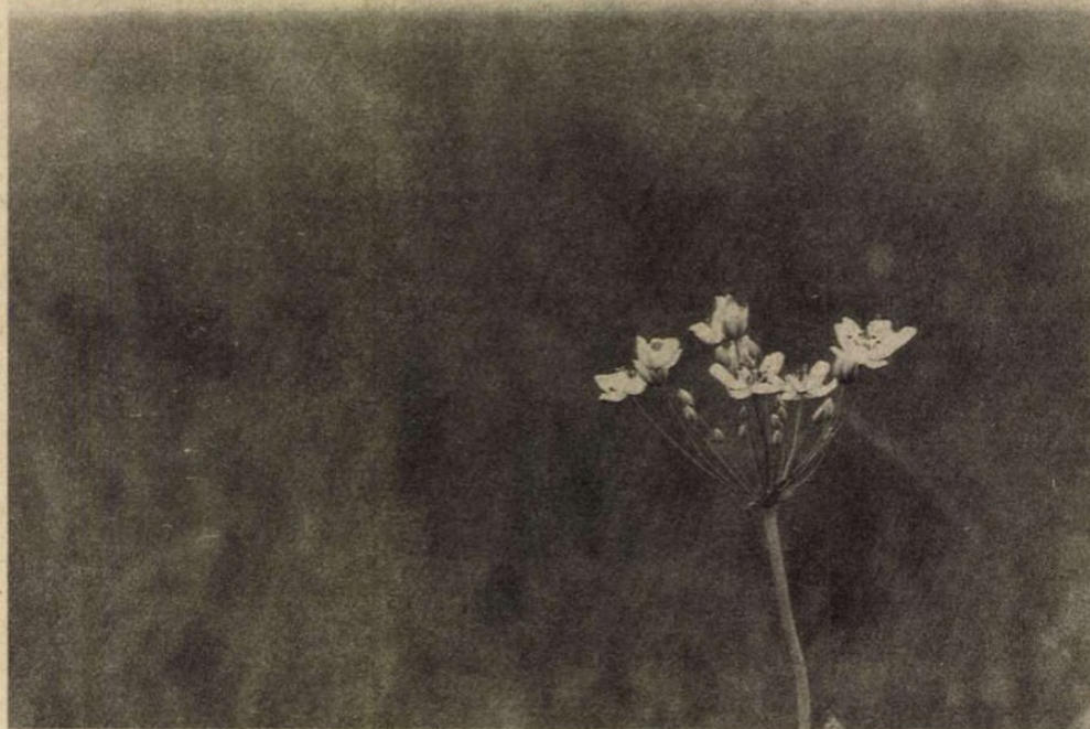
Az egyik legszebb pusztai növény a virágkaka