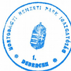
Szilágyi Gábor igazgató