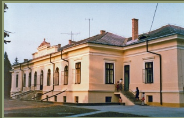
A kastély 1989-ben

A múlt század közepétől úttörőtaborként használták, később általános iskola és napközi működött benne. 1958-tól az Állami Gyermeknevelő Otthon 55 fős létszámmal bentlakásos intézetet hozott létre, majd többszöri átépítés révén 80, később 100 férőhelyes koedukált otthont alakítottak ki.